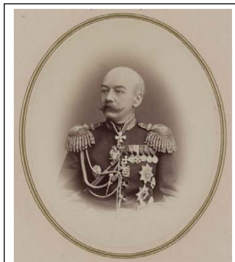
Константин Петрович Кауфман. Фотография 1860-х годов